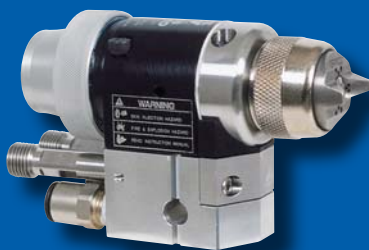
Автоматические краскораспылители G40