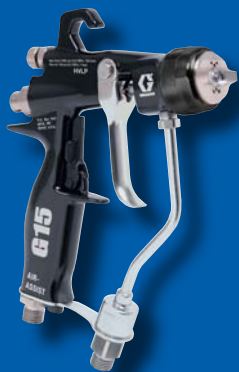
Ручные краскораспылители G15/G40

Рекомендуется для высококачественной окраски при низком и среднем давлении. Наконечники AAF оснащены предварительным рассекателем, который улучшает распыление отделочных материалов в том числе вододисперсионных красок и лаков. Закажите необходимое сопло (номер детали AAFxxx).